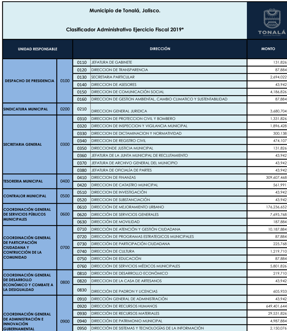
Municipio de Tonalá, Jalisco. Clasificador Administrativo Ejercicio Fiscal 2019*